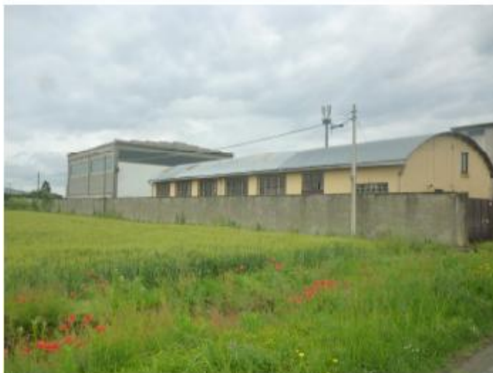
2- Accesso carraio da Strada Mandria