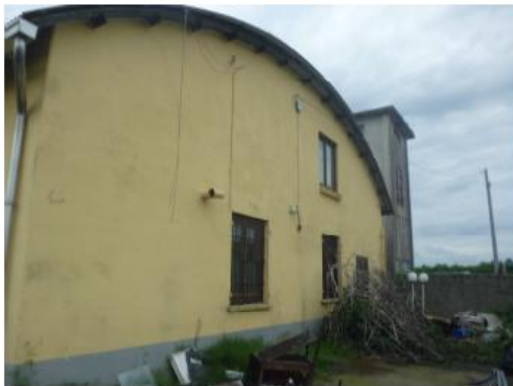
6- Cortile e muro di confine sud-ovest