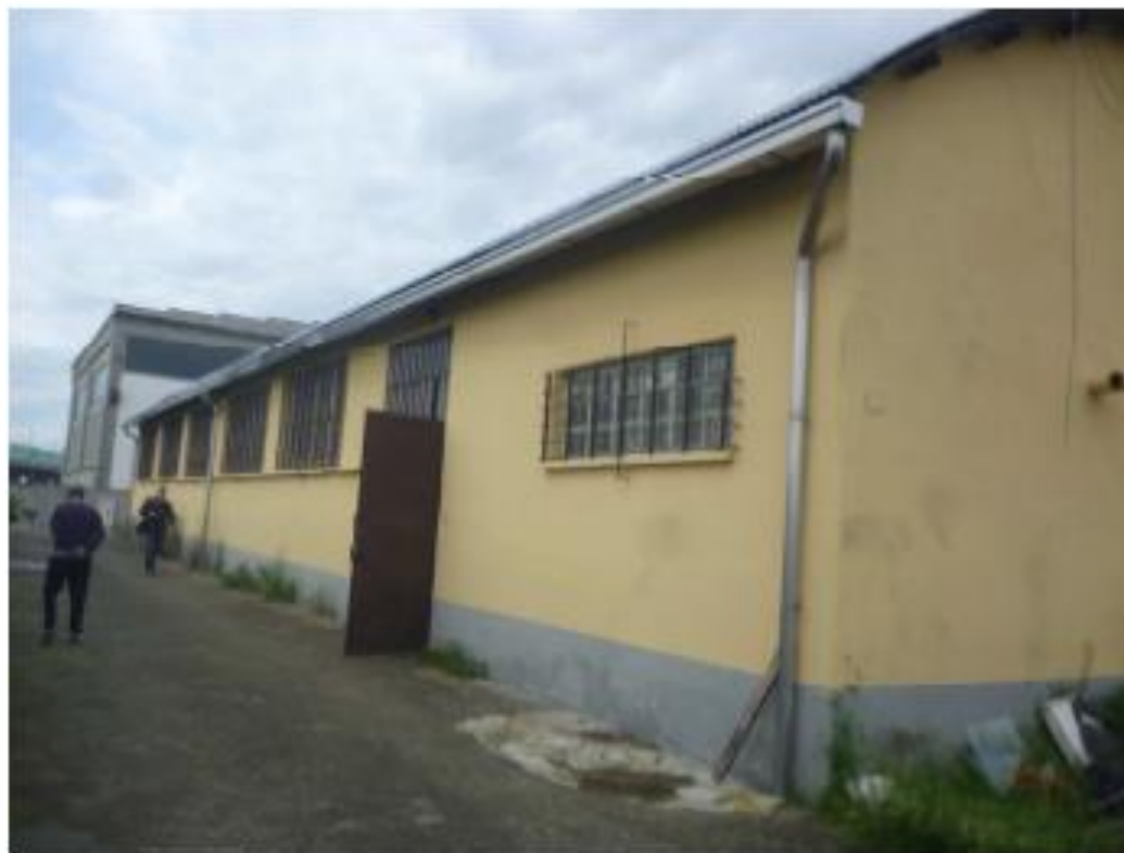
4- Fronte sud-ovest