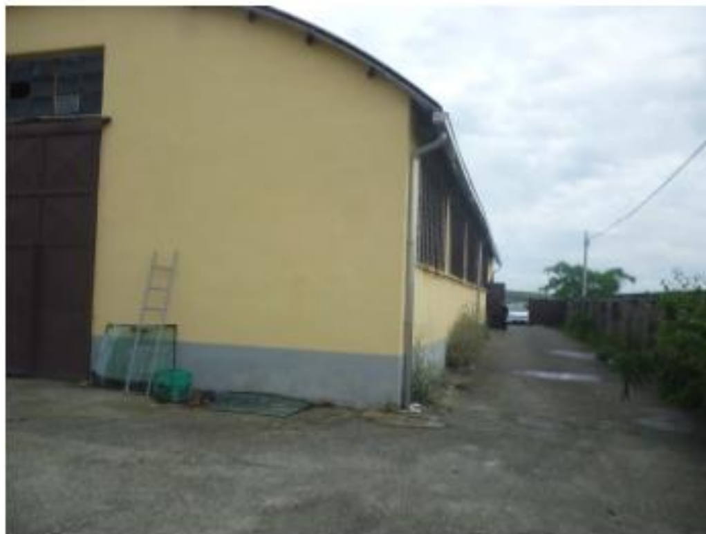
8- Fronte nord est –nord ovest